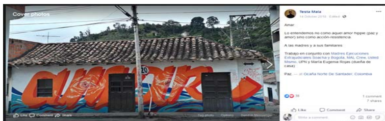
Imagen 1: Fotografía del mural tomada por Testa Mala, utilizada para difundir el trabajo hecho en Ocaña, publicada el 14 de octubre de 2018. Disponible en: https://www.facebook.com/photo.php?fbid=10161020760635437&set=a.10151482421035437&type=3&theater