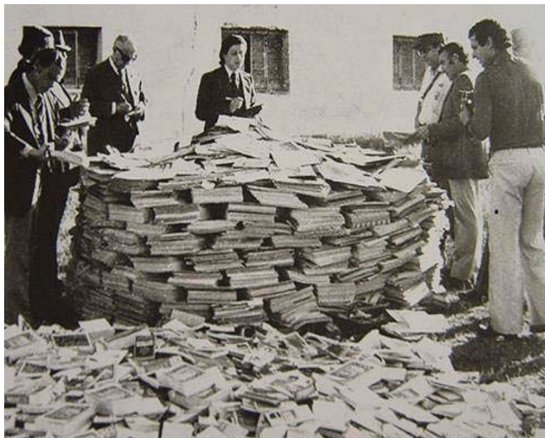
Quema de libros III Comando del Ejército. 29 de abril de 1976. Córdoba. La Voz del Interior , 30 de abril de 1976.