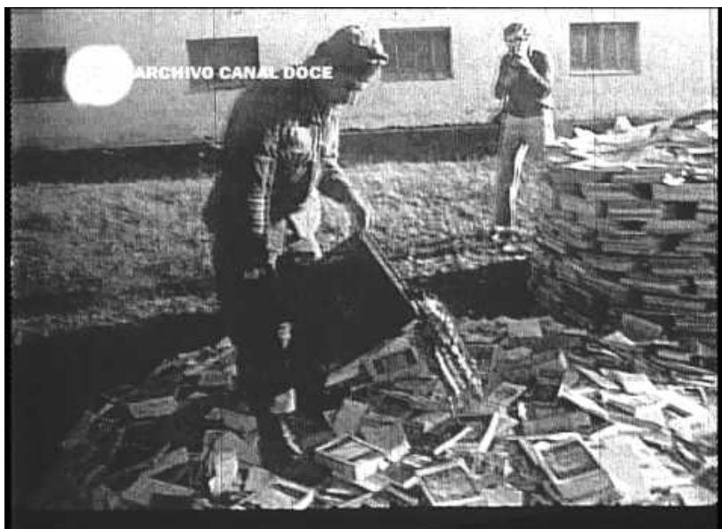
Quema de libros III Comando de Ejército. 29 de abril de 1976. Córdoba.