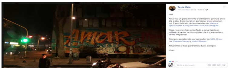
Imagen 2: Fotografía del mural en la Universidad Pedagógica Nacional, publicada por Testa Mala el 17 de noviembre de 2018. Disponible en: https://www.facebook.com/photo.php?fbid=10161142006425437&set=a.10151482421035437&type=3&theater