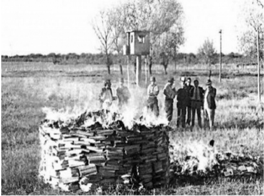
Quema de libros III Comando de Ejército. 29 de abril de 1976. Córdoba. La Voz del Interior , 30 de abril de 1976.

Menéndez diría en relación a esta «quema purificadora del ser nacional», como lo enunciaba el poder militar, que lo hacían «a fin de que no quede ninguna parte de esos libros, (...) de la misma manera que destruimos por el fuego la documentación perniciosa que afecta el intelecto y nuestra manera de ser cristina, serán destruidos los enemigos del alma argentina» (Diario La opinión , 30 de abril de 1976). 1