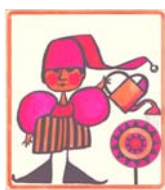
Ilustración de La Torre de Cubos

decreto nacional. A partir de ahí la pasé bastante mal. Porque no se trataba de una cuestión de prestigio académico o de que el libro estuviera o no en las librerías. Uno tenía un Falcon verde en la puerta. Yo vivía en Córdoba y más de una vez tuve que dormir afuera. Finalmente nos vinimos con mi marido a Buenos Aires en busca de trabajo y anonimato. Durante todo ese período quise publicar y no pude. (...) Maravillosamente el libro siguió circulando pero sin mi nombre: era incluido en antologías, los maestros hacían copias a mimeógrafo y se los daban para leer a los alumnos. Muchos lectores se me acercaron después y me dijeron que habían leído mis cuentos en papeles sueltos, sin saber de quién eran. Recuerdo varias Ferias del Libro en las que las maestras me acercaban esas hojas mimeografiadas para que se las firmara. (...) Tengo grabadas imágenes bastante alucinantes de los atardeceres en la ciudad de Córdoba: gente que deambulaba por las calles con paquetitos, con valijas donde llevaban los libros, cuando se iban a dormir de un lado al otro. Parecían caracoles con sus caparazones a cuestras. Así era todo, silencioso y sórdido. (Laura Devetach)