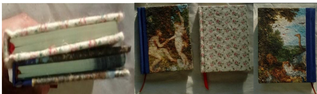
Libretas forradas con papel de lana y encuadernadas