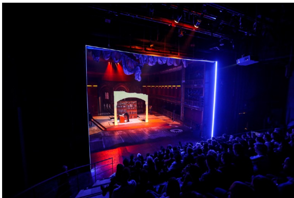
Figura 1. SBDM. Función del 10 de octubre de 2018 Gentileza TNA-TC.

En la cuarta escena, se propone la écfrasis del cuadro San Jerónimo en su estudio de Antonello da Messina, de la década de 1470. Se retoma, una vez más, una metaficción plástica para reformularla escénicamente (fig. 1).